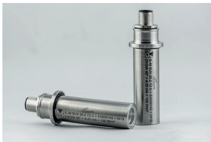
sensor para ser introducido

Nuestros sensores UV pueden ser configurados de manera flexible y ajustados óptimamente de acuerdo a los requerimientos del cliente .